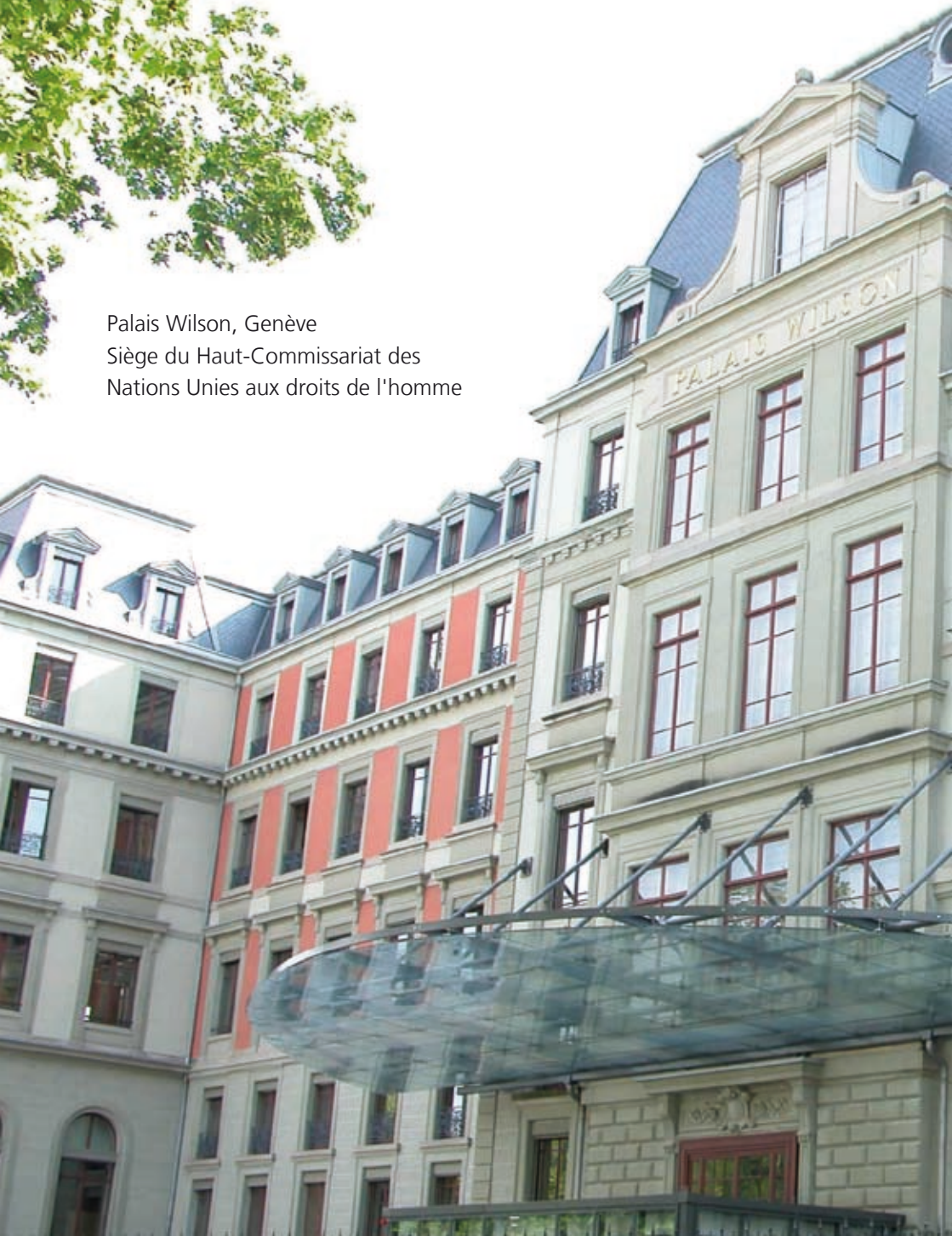
Palais Wilson, Genève Siège du Haut-Commissariat des Nations Unies aux droits de l'homme