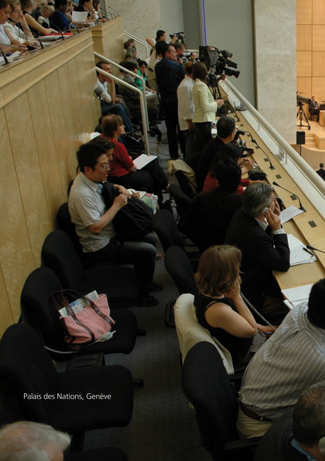
Palais des Nations, Genève